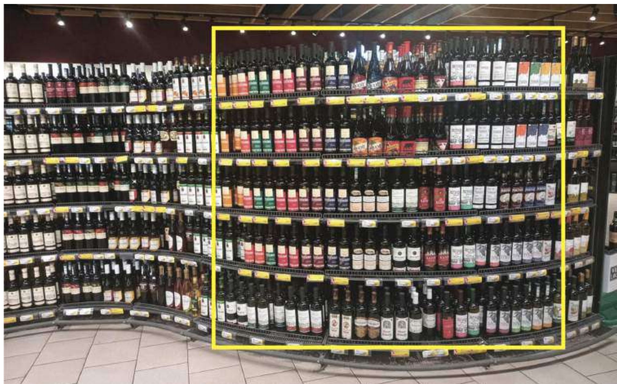
Средняя доля полки 17% от общей категории вин.