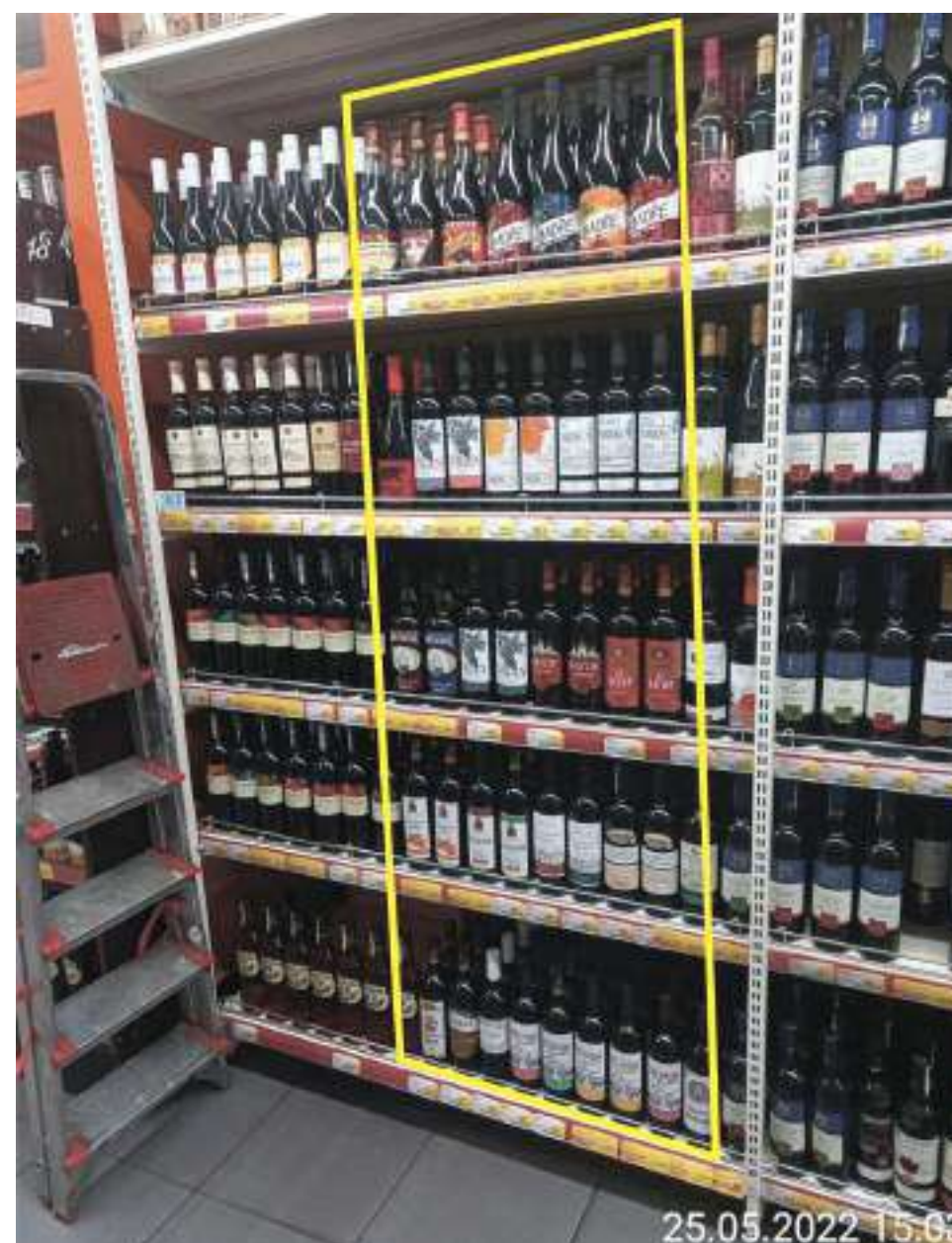
Минимальная доля полки 15% от общей категории вин.