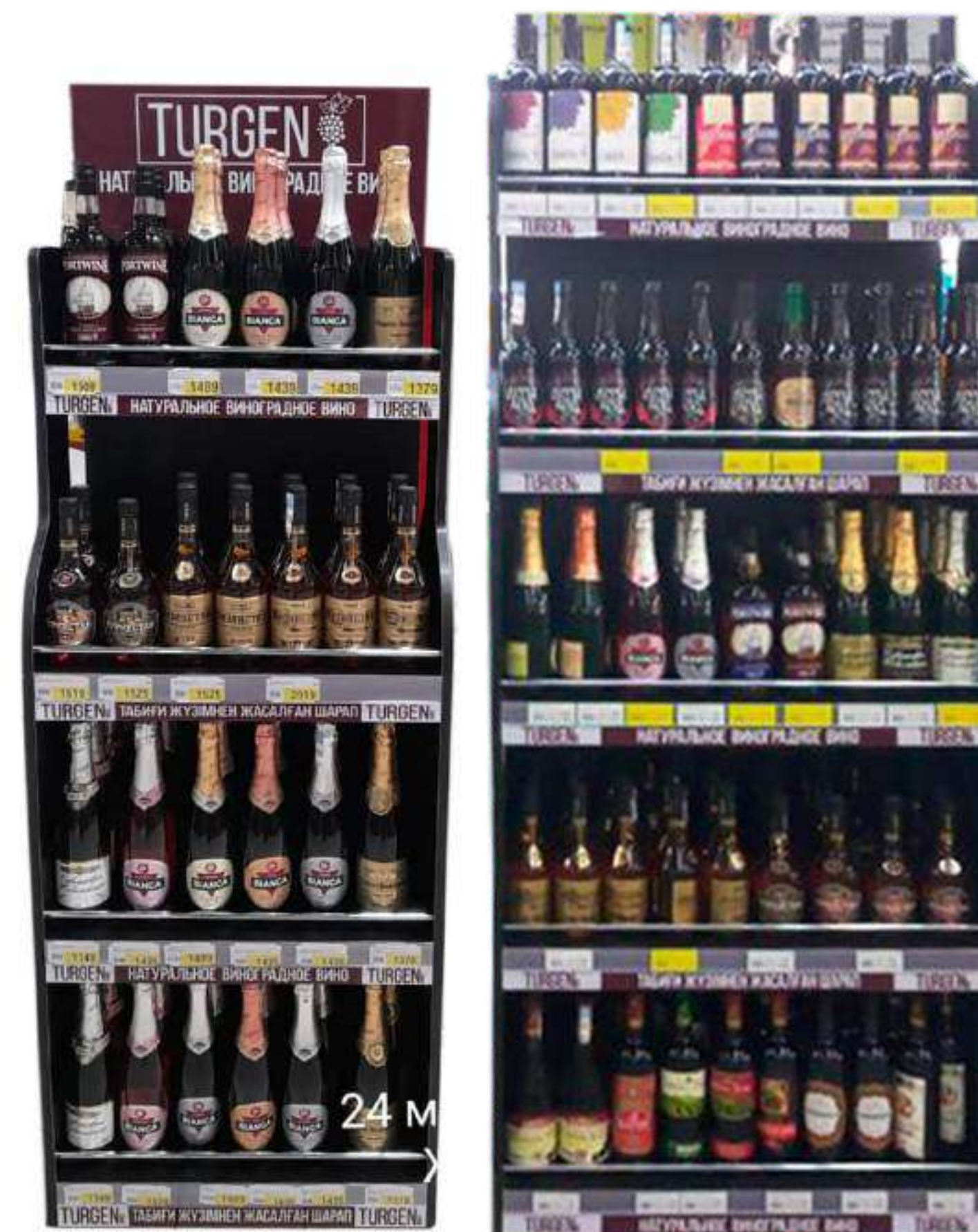
Дополнительная выставленность в ключевой рознице