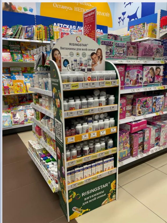
БАДы в ДМ