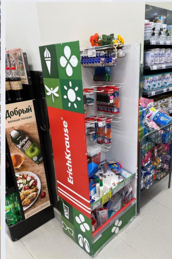
Снова в школу