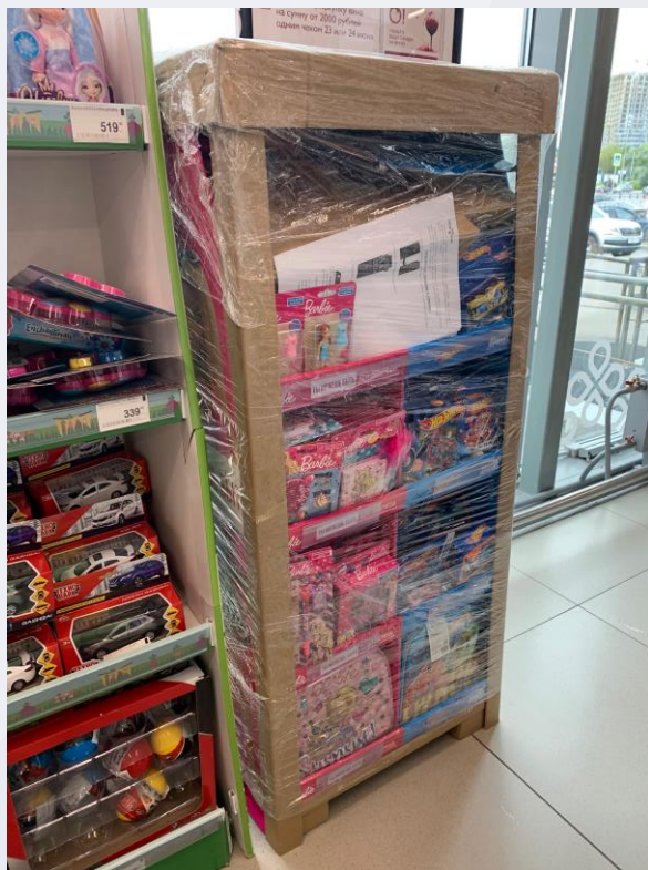
Лучше, НО риски