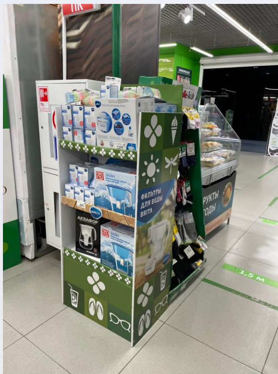
Фильтры для воды в Перекрестке