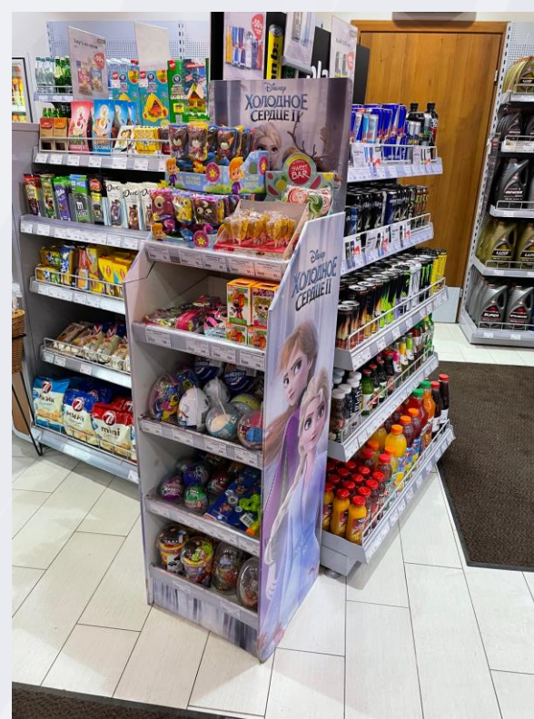
Игрушки в магазине у дома