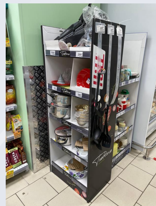
Кастрюли в Пятерочке