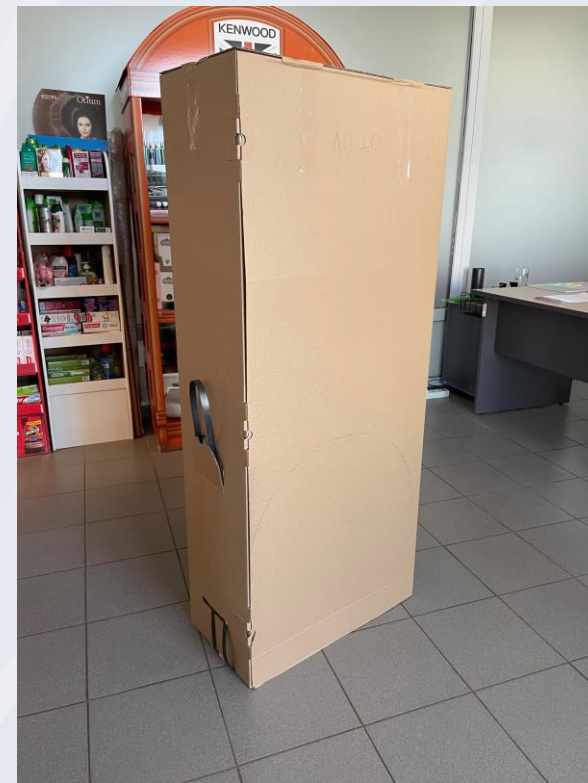
Гарантия качества, удобно для манипуляции