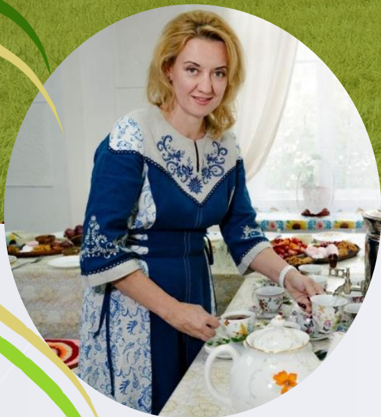
КАНАЕВА АЛЛА НИКОЛАЕВНА